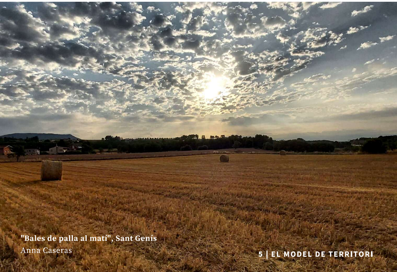
"Bales de palla al matí", Sant Genís

El Departament de Territori amb el vistiplau de la MICOD s'ha proposat crear una reserva de sòl industrial a la Conca d'Òdena (300-400 ha de superfície plana) perquè estigui a disposició de ser ofert a possibles empreses logístiques multinacionals que utilitzen grans magatzems i que busquin una gran extensió de sòl per ubicar-s'hi. Per tal de donar legalitat a aquesta voluntat política la Generalitat està redactant un Pla Director Urbanístic per Activitats Econòmiques ( PDUAE ) de la Conca d'Òdena de caràcter supramunicipal , el qual permetria fer la reserva de sòl però prendria les competències actuals dels set Ajuntaments per planificar polígons en el futur. Aquest pla supramunicipal i d'àmbit estrictament econòmic determinarà de facto el model territorial de la Conca.